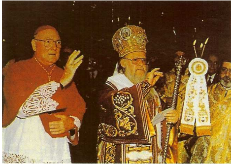
Ο Βαρθολομαῖος συλλειτουργεῖ καί συνευλογεῖ μέ τούς παναιρετικούς καί ἐκδιώκει τή συμπράξει ἁγιορειτῶν καί τῆς Ἑλληνικῆς πολιτείας τούς Ὁρθόδοξους μοναχοὺς τῆς Ἐσφιγμένου.

Οί τοπικές Ὁρθόδοξες Σύνοδοι εἴτε ἦσαν προγενέστερες τῶν Οἰκουμενικῶν Συνόδων καί ἀπέκτησαν Οἰκουμενικό