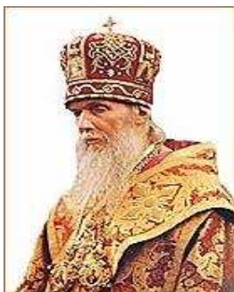
Ὁ Ἅγιος Φιλάρετος, Μητροπολίτης τῶν Ρώσων τῆς Διασποράς, πού πρῶτος ἀναθεμάτισε τόν Οἰκουμενισμό παγκοσμίως τό 1983 στό Μόντρεαλ τοῦ Καναδά

Μία ἀπό τίς βασικές κατηγορίες, πού μᾶς ἀπευθύνουν οἱ Νεοημερολογίτες σέ μελέτες μας πού γράψαμε παλαιότερα 39 εἶναι, ὅτι ἔλκουμε τήν διαδοχή καί τήν ἱερωσύνη μας ἀπό τούς Ρώσους τῆς Διασποράς, καί συγκεκριμένα ἀπό τήν Σύνοδο τοῦ Μακαριστοῦ Πρωθιεράρχου Μητροπολίτου Ἁγίου Φιλαρέτου .