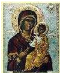
The Montreal Myrrh-streaming Iveron Icon of the Mother of God.

From the compendium Sermons and Teachings of St. Metropolitan Philaret, v. II, (Russian Orthodox Youth Committee, New York, 1989).