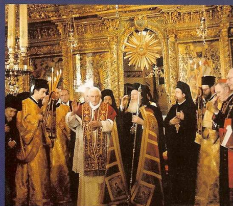
Συνευλογία: Βαρθολομαίου - αντίχριστου πάπα Ράτσινγκερ.