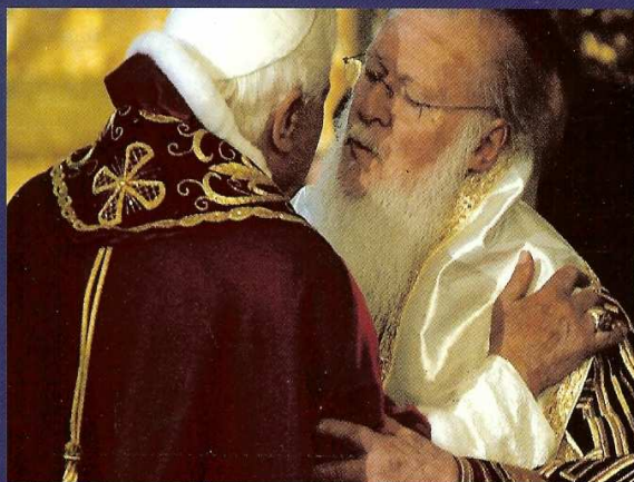
ΛΕΙΤΟΥΡΓΙΚΟΣ ΑΣΠΑΣΜΟΣ ΒΑΡΘΟΛΟΜΑΙΟΥ ΚΑΙ ΠΑΠΑ, Ο ΟΠΟΙΟΣ ΦΕΡΕΙ ΚΑΙ ΕΠΙΣΚΟΠΙΚΟΝ ΩΜΟΦΟΡΙΟΝ ΚΑΤΑ ΤΗΝ ΛΕΙΤΟΥΡΓΙΑ ΤΗΣ 30-11-2006 ΕΙΣ ΤΟΝ ΠΑΤΡΙΑΡΧΙΚΟΝ ΝΑΟΝ ΤΗΣ ΚΩΝ/ΠΟΛΕΩΣ

«Ὁ δὲ Ἰησοῦς εἶπεν αὐτῷ· Ἰούδα, φιλήματι τόν Υἱόν τοῦ ἀνθρώπου παραδίδως;» (Λουκ. κβ' 48-49.