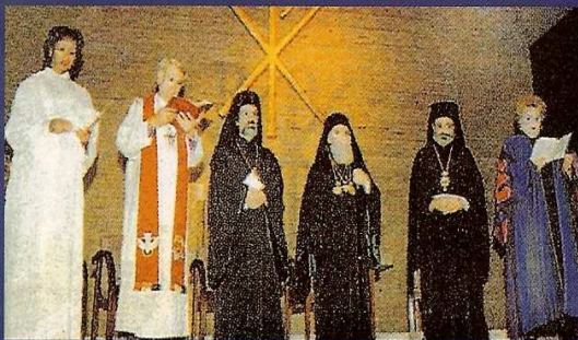
Συμπροσευχή Βαρθολομαίου με ἱεροφορεμένες παπαδίνες εἰς ΗΠΑ. (25.10.1997)