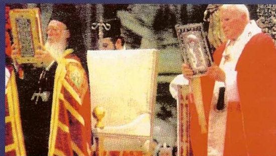
Συλλειτουργία Βαρθολομαίου καὶ ἀντιχρίστου πάπα εἰς Βατικανόν. (29.6.1995)

Ὁ Βαρθολομαῖος ὑποδέχεται τόν ἀντίχριστον πάπα ὡς τοποτηρητὴν» τοῦ Χριστοῦ με τὴν προσφώνησιν: